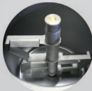
New mixing rotor